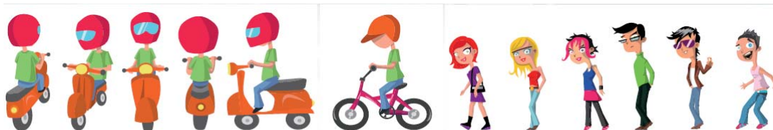
Le pion scooter sous tous les angles, le pion vélo et les personnages du jeu.